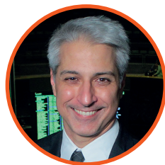
ALESSANDRO MOLON Congressman

Another Brazil is possible. Our time is here!