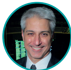
ALESSANDRO MOLON Deputado Federal

Um outro Brasil é possível. Chegou a nossa hora!